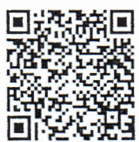
รายละเอียดและแบบฟอร์มข้อเสนอคำขอ

สำนักงานปลัดกระทรวง กองการต่างประเทศ โทรศัพท์ ๐ ๒๖๑๐ ๕๔๕๐ (เจะยี่สนะฮ) โทรสาร ๐ ๒๓๕๔ ๕๕๗๐