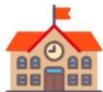
เข้าสู่ สถานศึกษา