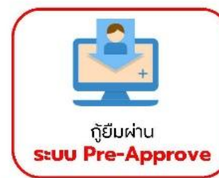
กู้ยืมผ่าน ระบบ Pre-Approve