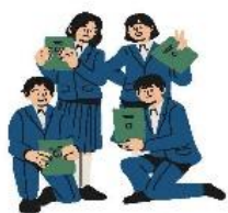
นักเรียน/นักศึกษา