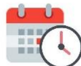
ดำเนินการตามขั้นตอนและ กำหนดการของสถานศึกษา ภายในเวลาที่กองทุนกำหนด